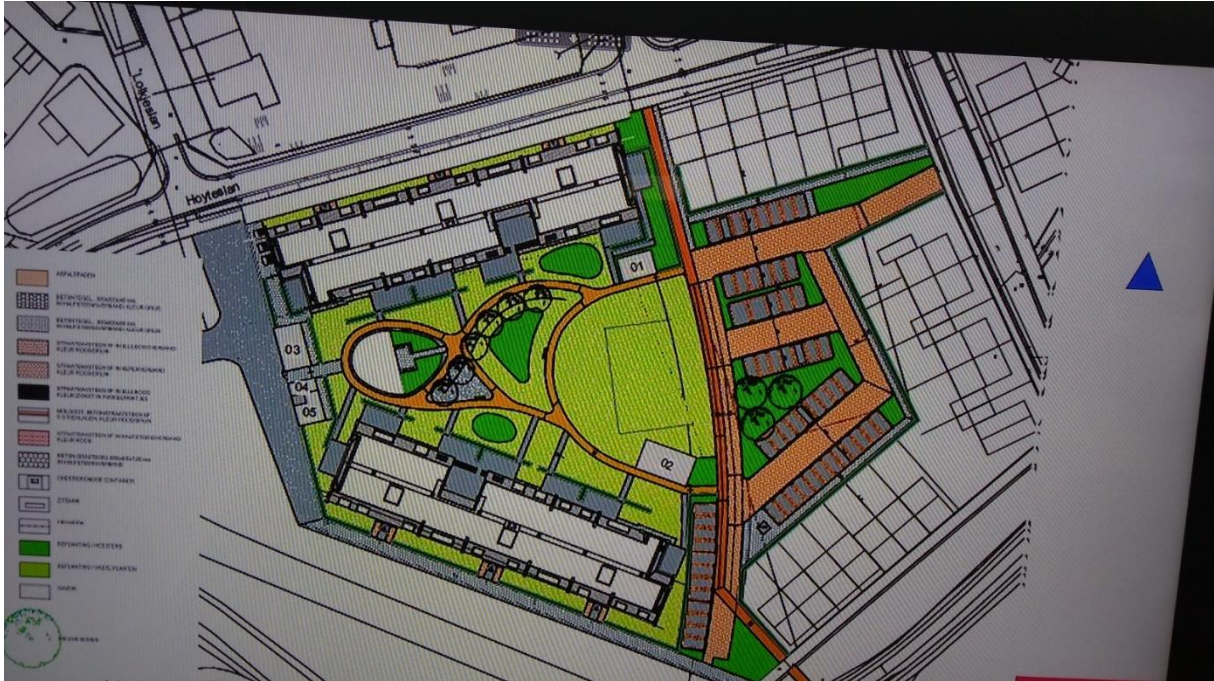
Bovenaanzicht. De donkeroranje kleur is het fietspad vanaf Techumerdyk naar Lykwei. Lichtgroen is de binnenplaats van Noorderbreedte, afgeschermd door een groen hekwerk met beplanting langs het fietspad. Links het grijze gedeelte voor laden en lossen.