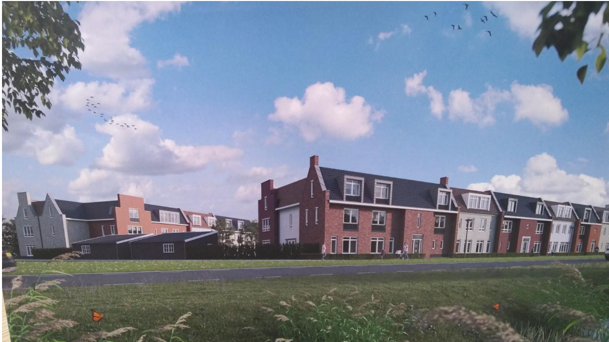
Foto met aanzicht vanaf Sudertrimdsdielyk. Bij de zwarte schuren zal het laden en lossen gesitueerd worden.